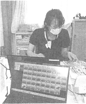
モニターで睡眠状態を“見える化”する

がり、離床を把握。呼吸や心拍数も計測する。基幹システムと連携して、モニターリングできるようにする。また、ナースコールの受信や電話機能を統合したインカムを導入。スタッフ間の情報共有をスムーズにする。さらに、入居家族らの同意を得て、廊下や各室な