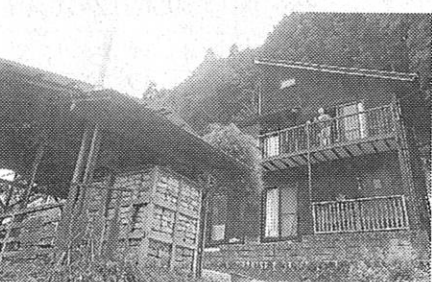
貸しコテージ「ファームインココ」

子ども1人)4500円(税込み)。人数の追加料金は、大人1人1500円、子ども1人1000円、2歳以下は無料。午前9時に同施設へ集合し9時半から体験、正午に昼食。午後1時半から自由研究、同3時半に卵の採取、午後3時45分に解散する。当日はメモや筆記