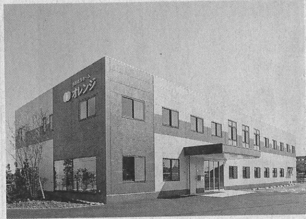
住宅型有料老人ホーム (安城)